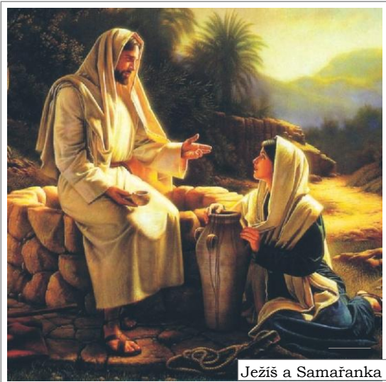
Ježíš a Samařanka

Pojem Syn člověka ale skutečně vešel v obecnou známost díky Kristu, který jej na sebe často vztahoval. Ježíš se tímto označením sám postavil do řady všech svých předchůdců hodných tohoto titulu.