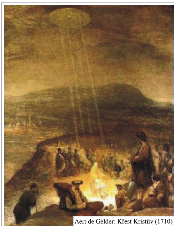
Aert de Gelder: Křest Kristův (1710)

Poznámka: Problematice ukřižování a otázky „tradičního vzkříšení“ se budeme věnovat v některé ze speciálních kapitol.